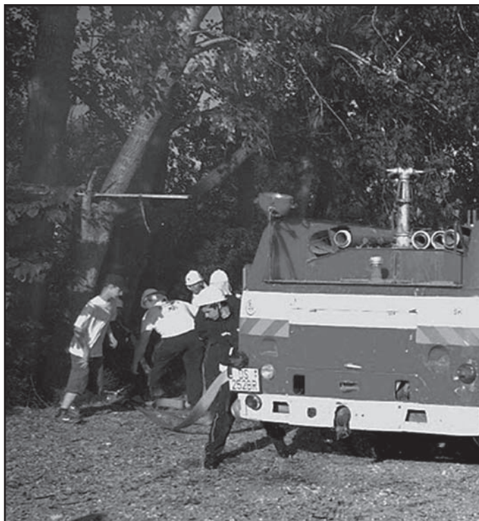
TŰZ A HÁROMHÁZI TÓNÁL 2010