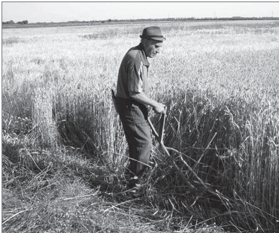
HAGYOMÁNYOS ARATÁS 2010